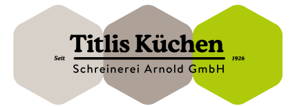
Schreinerei Arnold GmbH