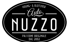
Auto Nuzzo GmbH